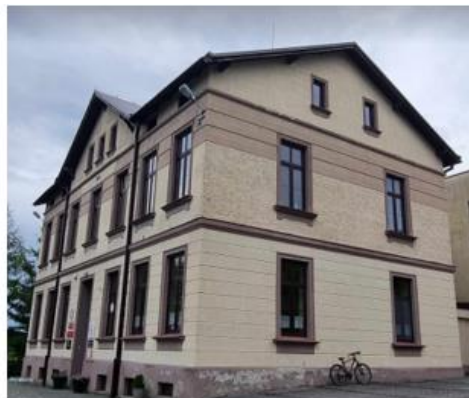
Fotografia 11. Widok na obiekty zabytkowe z Gminnej Ewidencji Zabytków stanowiące własność gminy – szkoła w Dębowcu (od lewej) i szkoła w Ogrodzonej (od prawej).

Stan techniczny wszystkich obiektów stanowiących własność gminy określić można jako dobry.