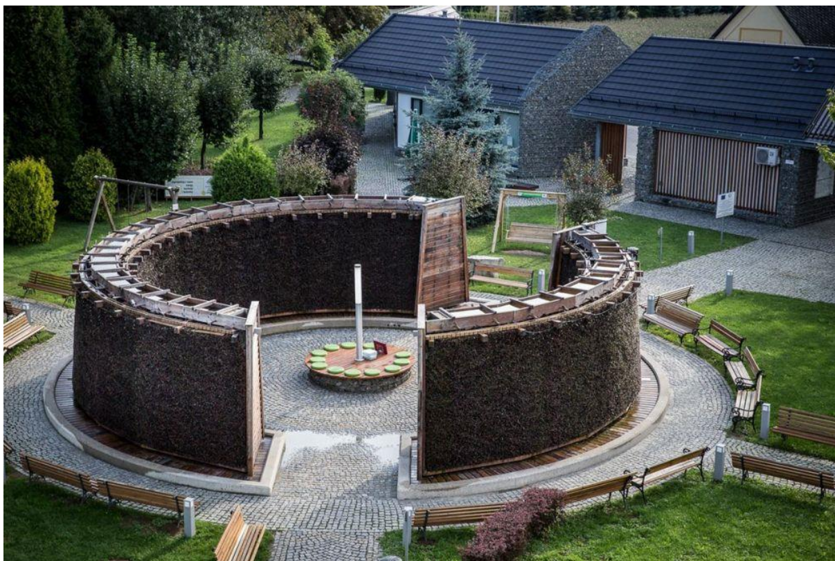
Fotografia 2. Tężnia solankowa w Dębowcu – jedna z głównych atrakcji turystycznych gminy.

Solanka z Dębowca posiada jedną z najwyższych w świecie koncentrację takich minerałów jak: jod, brom, wapń, krzem oraz selen i zaliczona jest Rozporządzeniem Rady Ministrów z lutego 2006 r. (Dz. U. nr 32/2006 poz. 220) do wód leczniczych i termalnych.