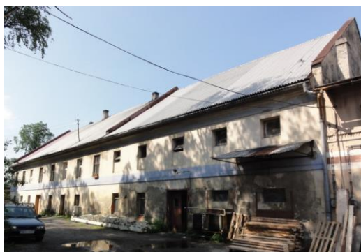
Fotografia 8. Widok na dawną gorzelnie w Simoradzu.

Dawna gorzelnia w Simoradzu to murowany obiekt w zespole folwarcznym. Stan zachowania obiektu – dostateczny. Sugerowana konserwacja elewacji.