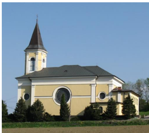
Fotografia 10. Widok na kościół pw. św. Mateusza w Ogrodzonej.

Za kolejnego proboszcza w Ogrodzonej ks. Tadeusza Pietrzyka zaraz na początku jego posługi w parafii dokończono budowę parkingu kościelnego z kamiennym podłożem, następnie w 2002 r. ułożono chodnik