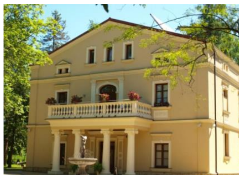
Fotografia 4. Widok na dwór w Dębowcu.

Wśród obiektów dworskich wyróżnia się dwór w Dębowcu. Przed I wojną światową należał do właścicieli dóbr dębowieckich - ostatnim z nich był książę cieszyński Fryderyk Habsburg. Jest to piękny, klasycystyczny dworek ze stylowym portykiem wspartym na kolumnach.