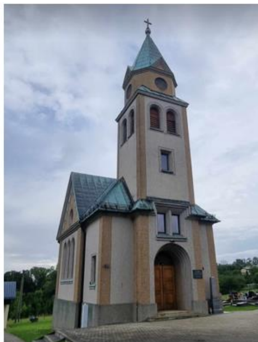
Fotografia 3. Kościoły ewangelickie w Dębowcu (od lewej) i Simoradzu (od prawej).

W krajobrazie gminy Dębowiec odnaleźć można pozostałości dawnych folwarków i zespołów dworskich (m.in. w miejscowościach Ogrodzona, Dębowiec, Simoradz, Kostkowice). Do obecnych czasów pozostały głównie obiekty gospodarcze, charakteryzujące się złym stan technicznym.