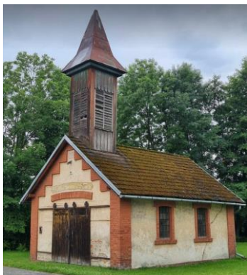
Fotografia 5. Widok na dawną strażnicę OSP w Dębowcu.

Na terenie Gminy Dębowiec przeważa zabudowa mieszkaniowa jednorodzinna i zagrodowa. Zabudowę stanowią przede wszystkim budynki jedno i dwukondygnacyjne o zróżnicowanej geometrii połaci dachowej. Zabudowa mieszkaniowa jednorodzinna występuje przeważnie wzdłuż głównych dróg publicznych oraz w centralnych częściach sołectw, natomiast zabudowa zagrodowa rozproszona jest na całym terenie gminy. Do licznej zabudowy na terenie gminy należy także zwarta zabudowa produkcji rolno – hodowlanej zlokalizowana między innymi w Simoradzu, Dębowcu, Kostkowicach i Ogrodzonej, gdzie występują funkcje usługowe i produkcyjno – usługowe.