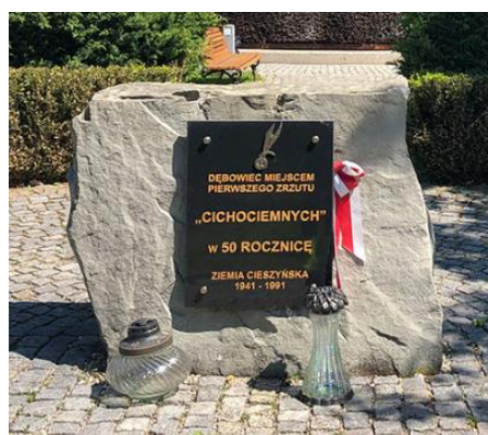
Fotografia 6. Widok na obelisk upamiętniający fakt pierwszego zrzutu „Cichociemnych”.