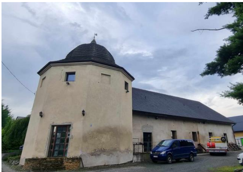
Fotografia 7. Widok na dawny spichlerz rotundę w Dębowcu.

Stan zachowania obiektu dostateczny. Widoczne zawilgocenia przyziemia.