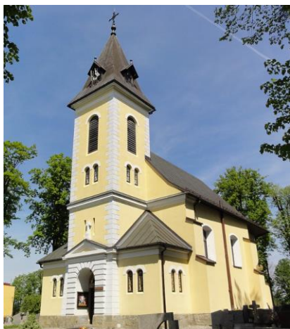
Fotografia 9. Widok na kościół pw. św. Jakuba w Simoradzu. budynku.

Według informacji dostępnych na stronie internetowej Parafii św. Jakuba Ap. w Simoradzu, pierwotna świątynia wzniesiona została prawdopodobnie w XIII wieku. Tak, jak obecnie była murowana i posiadała osobną dzwonnice. Obecna, murowana świątynia została wzniesiona ok. XV wieku. W 1842 r. została rozbudowana, a następnie kilkakrotnie remontowana w XX wieku.