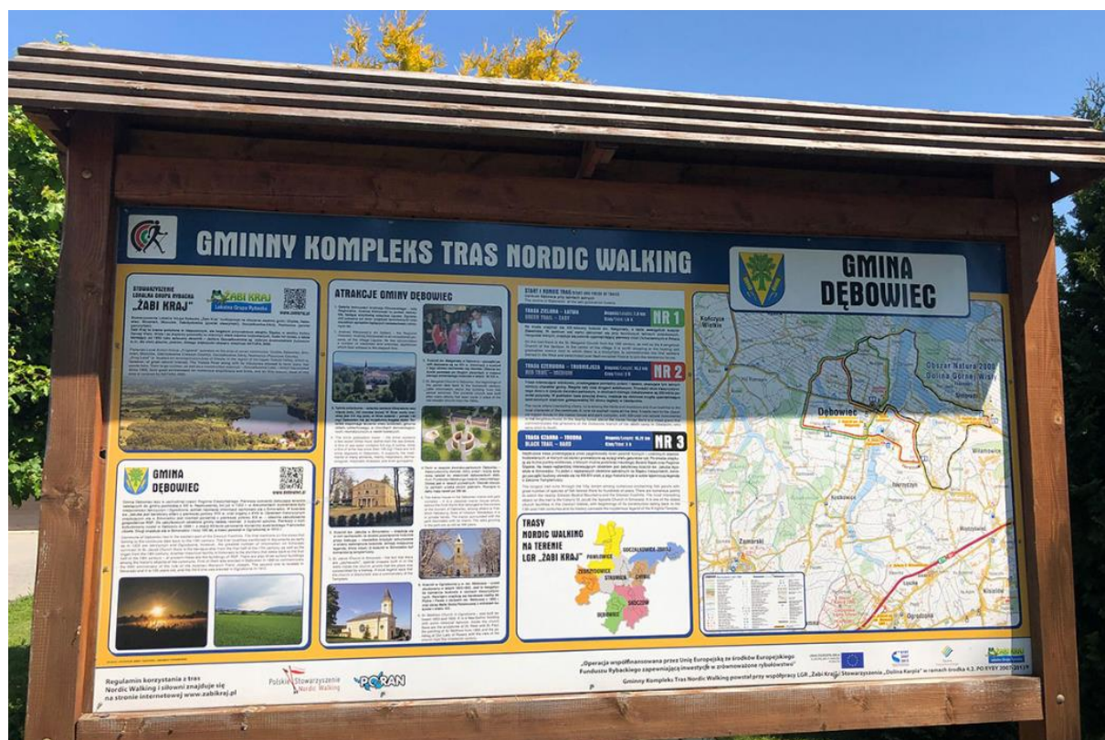
Fotografia 1. Mapa gminy Dębowiec z oznaczeniem szlaków nordic walking.

Gmina Dębowiec położona jest na trasie pieszych i rowerowych szlaków turystycznych.